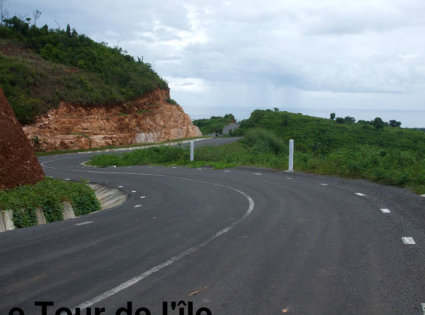
Le Tour de l'île

Très belle cascade avec son petit lac. Lieu de prière pour les Sakalava.