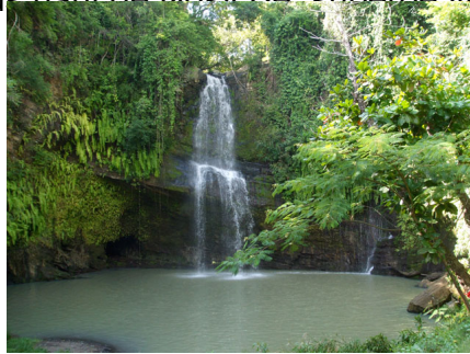
Le Petite Cascade

C'est l'un des points les plus hauts de Nosy Be, superbe vue panoramique et très beaux couchers de soleil.