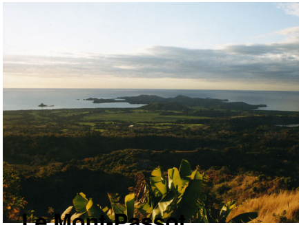
Le Mont Passot

C'est l'un des points les plus hauts de Nosy Be, superbe vue panoramique et très beaux couchers de soleil.