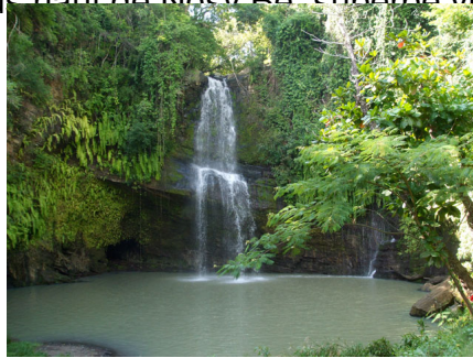
Le Petite Cascade

C'est l'un des points les plus hauts de Nosy Be, superbe vue panoramique et très beaux couchers de soleil.