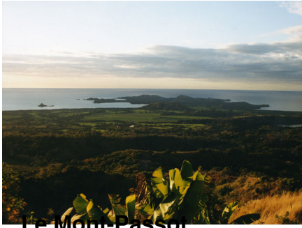
Le Mont Passot

C'est l'un des points les plus hauts de Nosy Be, superbe vue panoramique et très beaux couchers de soleil.