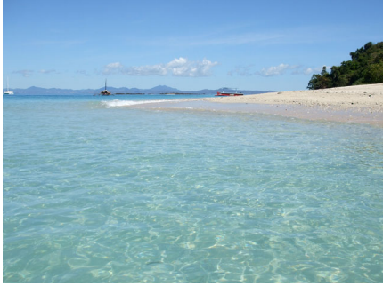
Nosy Komba et Tanikely

Visite de deux îles magnifiques, Nosy Komba avec son Parc, sa faune et sa Flore, et Nosy Tanikely avec